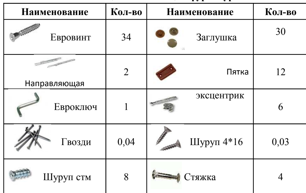
Монтаж эксцентриковой стяжки